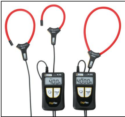
DigiFlex MA400D / MA4000D