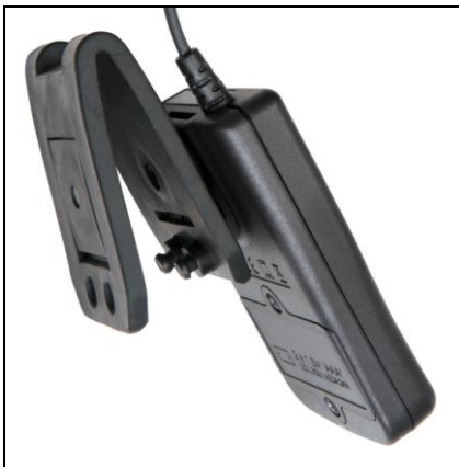
Volitelné příslušenství MULTIFIX